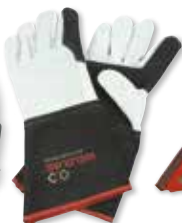
GANTS DE SOUDEUR CUIR MIG UNIVERSAL CONFORT + T10 Réf. 65195