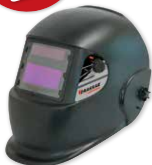
CAGOULE DE SOUDAGE AUTOMATIQUE TEINTE 9/13 VISION 95X36MM Réf. 05754