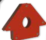
EQUERRE MAGNÉTIQUE 110X17MM Réf. 05772