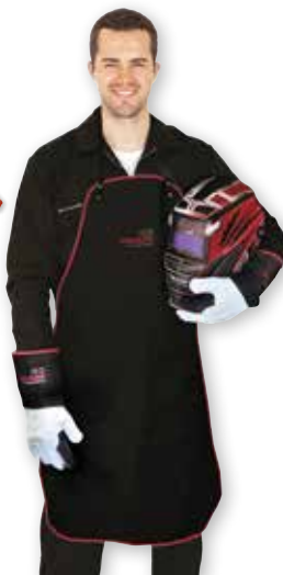
TABLIER DE SOUDEUR EN CROÛTE DE CUIR REFENDU AVEC LANIÈRES CUIR (uniquement tablier) Réf. 65360