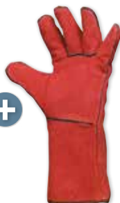
GANTS DE SOUDEUR CUIR DOUBLÉ MANCHETTE 160MM T10 Réf. 21106