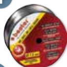
BOBINE DE FIL ACIER Ø 1,0MM 200MM 5KG Réf. 55014