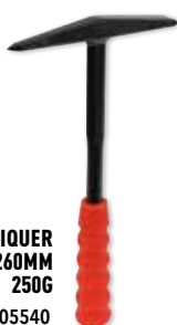
MARTEAU À PIQUER MANCHE ACIER 260MM 250G Réf. 05540