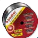
BOBINE DE FIL ACIER Ø 0,8MM 200MM 5KG Réf. 55012