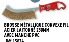
BROSSE MÉTALLIQUE CONVEXE FIL ACIER LAITONNÉ 250MM AVEC MANCHE PVC Réf. 15874